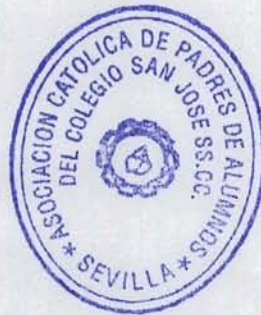
D a Ines Montes Galnares